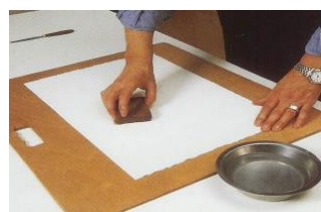
Vi våtspänner aquarellpapperet på målarbrädan