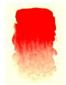
Cadm.röd, ljus nr 1072