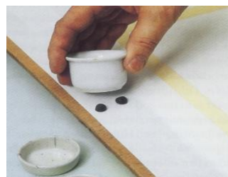
Vi fäster blandkoppar med häftmassa