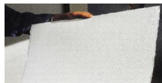
Aquarellpapperet har en spännande grov grain

Övrig materiel (exkl. ev. beställt mtrl-paket) an- skaffar du själv.