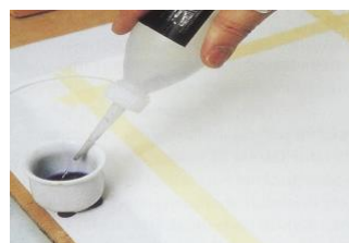
Plastflaska med pip