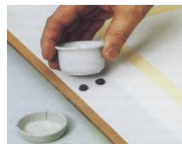
Du fäster blandkoppar med häftmassa