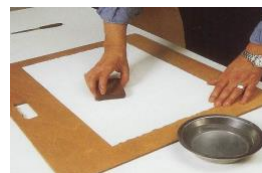
Du våtspänner aquarellpapperet på målarbrädan

Vi håller till på Ateljé/Studio Håkan Lindskog, Mariedalsvägen 4, 234 35 Lomma.