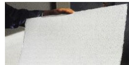
Aquarellpapperet har en spännande grov grain

OBS! Övrig materiel (exkl. ev. beställt mtrl-paket) anskaffar du själv.