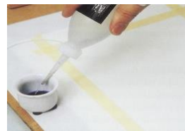
Plastflaska med pip